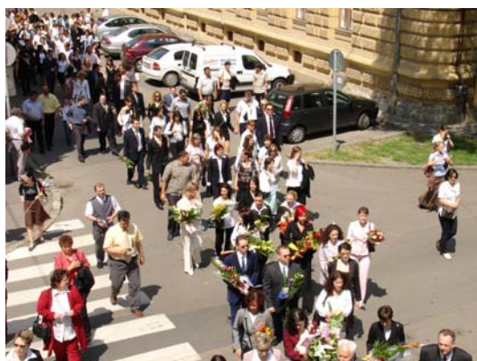
Megérkezés az ünnepség színhelyére