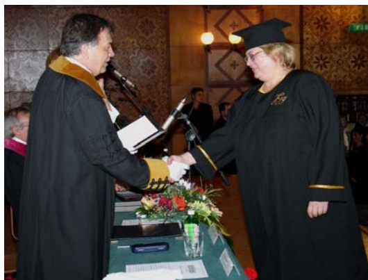
A diploma átadása