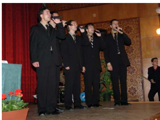
A Full Moon énekegyüttes műsora