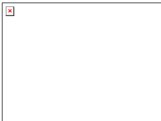
Indul a ballagási séta