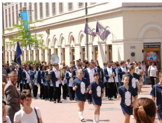
Juhászgyulások a Kárász utcán