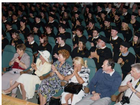
Taláros hallgatók, ünneplőbe öltözött vendégek