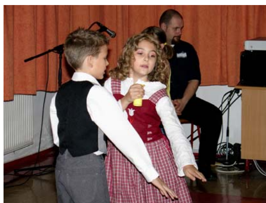
Gyakorló Általános és Művészeti Iskolánk növendékei