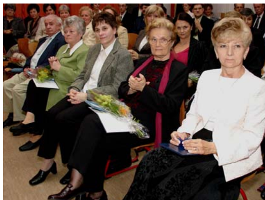
A pedagógusnap résztvevői